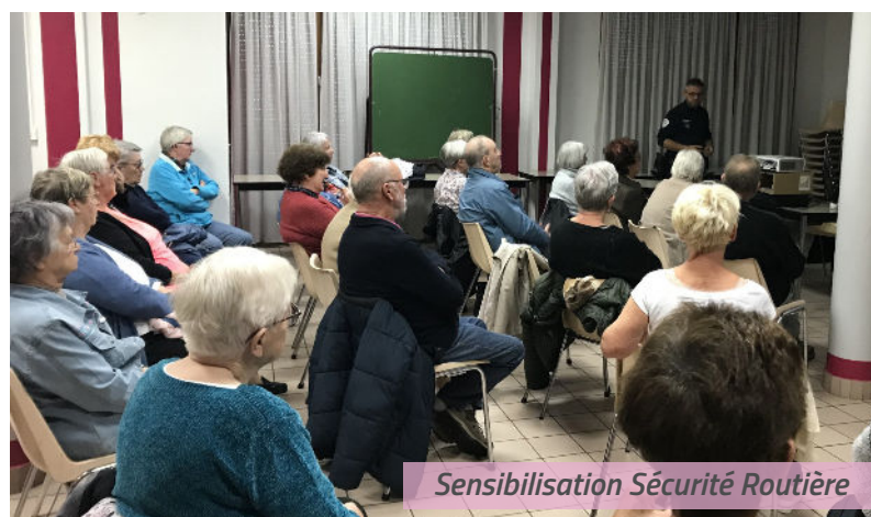
Sensibilisation Sécurité Routière