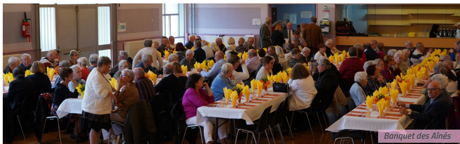
Banquet des Aînés