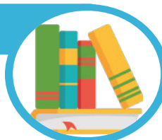
Schéma de lecture publique : convention de partenariat avec le Département du Pas-de-Calais

L'assemblée autorise à l'unanimité la signature de la convention de partenariat avec le Département du Pas de Calais relativement au Schéma de développement de la lecture publique, visant à offrir à la commune l'accès à différents services proposés par la médiathèque Départementale.